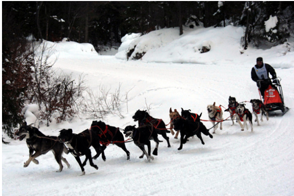
Un attelage d'illimité

Tôt le matin, les premiers équipages sont arrivés. Le parking a du être organisé car l'endroit est exigu. Fort heureusement, les mushers de la mi-distance sont habitués à des conditions parfois plus difficiles, leur exemple d'adaptation à cet espace restreint, a appris aux coureurs du sprint à gérer l'espace. Cette espace nordique est de toute beauté, et la majorité à beaucoup appréciée les pistes situées sur les hauts plateaux du Vercors proche de la réserve naturelle.