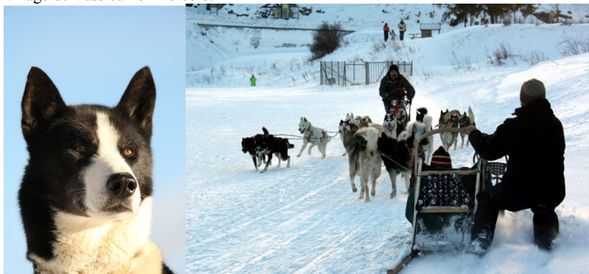
Exercice de croisement

Beaucoup de coureurs avaient fait le déplacement l'année d'avant (fin 2007). En effet, nombreux étaient ceux-ci dans les différents réveillons locaux. Cette arrivée avant l'heure a permis à certains de s'entraîner avant le lancement des épreuves sur une piste tracée près du village de Vassieux en Vercors.