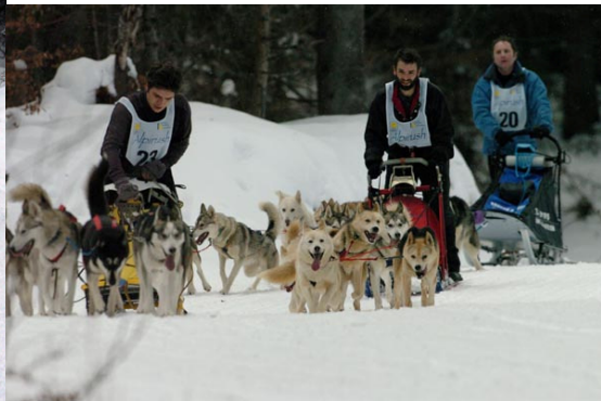
Des dépassements sans encombre.